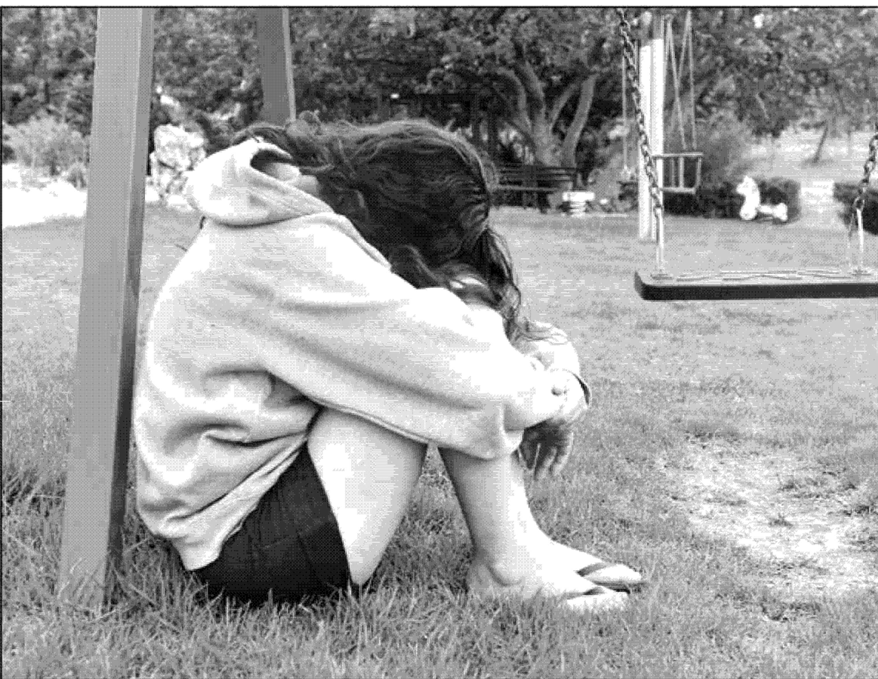
הילדים מתקשים להביע את החוויה במילים

יותר מ-60% מהתיקים שנפתחו במשטרה על פגיעה מינית בילדים נסגרו בהמלצת חוקרי ילדים, מחשש שעדות בביהמ"ש תסב להם טראומה נוספת • לגישה זו מתנגדים מרכזי טיפול בקורבנות ופסיכיאטרים • "כאב הקורבן, שרואה שהנאשם לא נענש, עלול להיות חזק יותר מהטראומה עצמה"