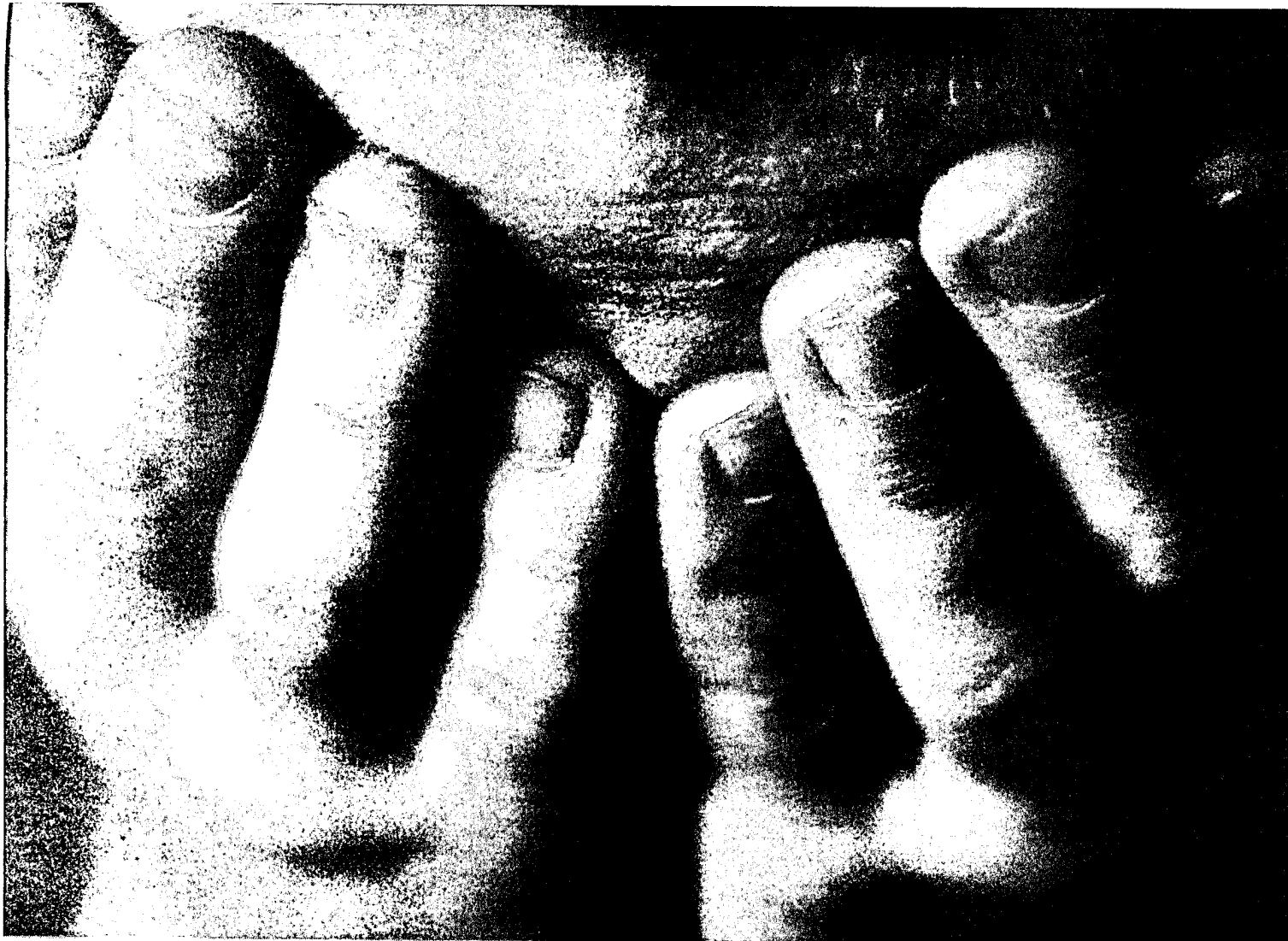
9,624 ילדים עד גיל 14 נחקרו בחשר שנפגשו מעבדות מין ואלמות ■ צילום הסחפה אינגרס אופו

ילד יכול לספר ולהאשים מישהו. הלשנה על הרב או על כל אדם מבוגר אסורה מבינתו. בוודאי אם אותו מבוגר איים עליו שאסור לו לספר. מעבר לכך, גם אם הילד סיפר להורים, לספר ולהתלונן ולהי שוף זה משהו שיכול לפגוע בכל המשפחה, בשידור כים של הילדים, ביחסים עם השכנים. מעבר לפגיעה הנפשית לכל החיים, החברה לא מתייחסת בסלהנות לנפגעים בנושא המיני, אלא זוכרת להם את זה. זה קורה גם בחברה ההילוגית, ובוודאי בהברות סגורות. ראינו איך משפחה של ילדה בקיבוץ נאלצה להיות זו שעזבה את המקום. ובוודאי שבהברת שבה יש ערך לכתולים רבר כזה מכתים. עצם הדיווח מכתים את כל המשפחה. אם רב גדול יעשה משהו לילד זה מאוד לא פשוט לקום מולו. החברה מאוד מתקשה להאמין שאדם במעמד רחוני גבוה יבצע כאלה דברים. אנחי נו רואים את הדבקות של התלמידים של הרב מוטי