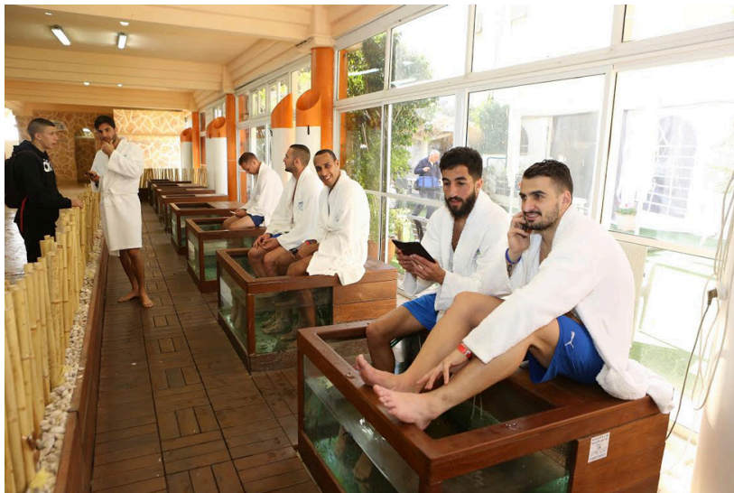
שחקני הפועל באר שבע בספא