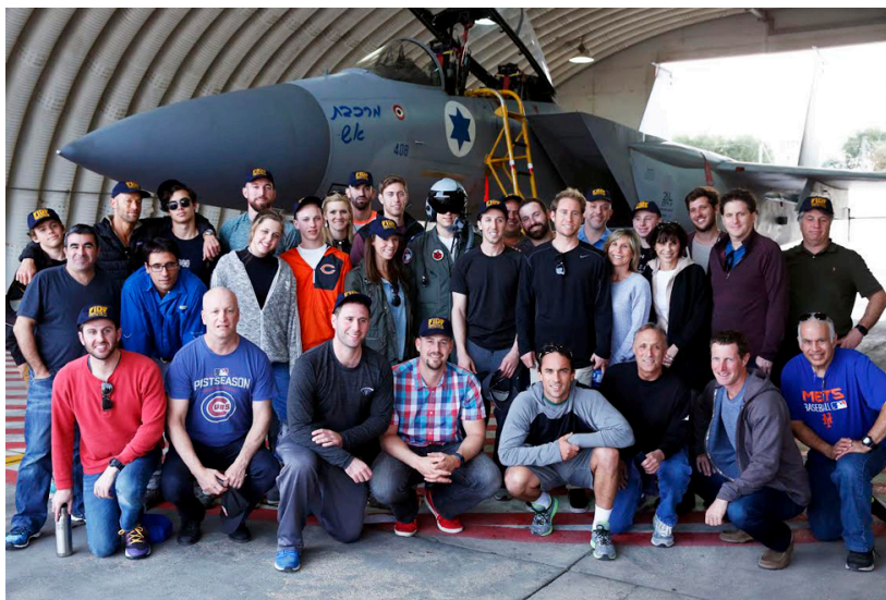
ביקור שחקני הבייסבול בתל נוף