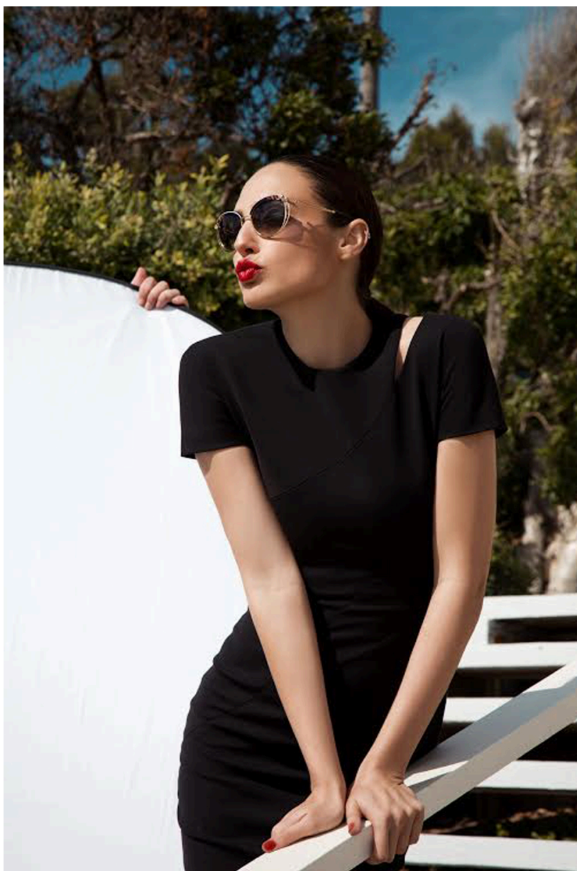
גל גדות בצילומים