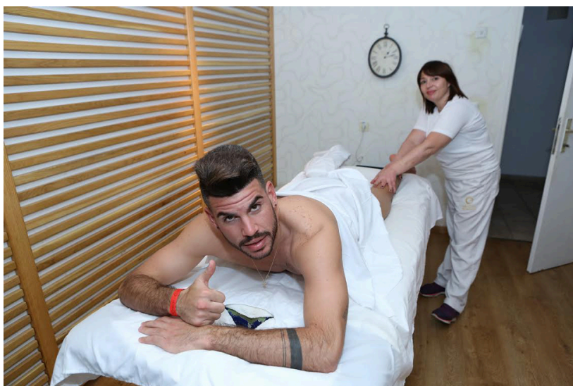
שחקן הפועל בבאר שבע בטיפול