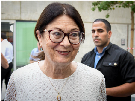
אסתר חיות

11/12/2019 | אסתר חיות | נאומים | תגובות