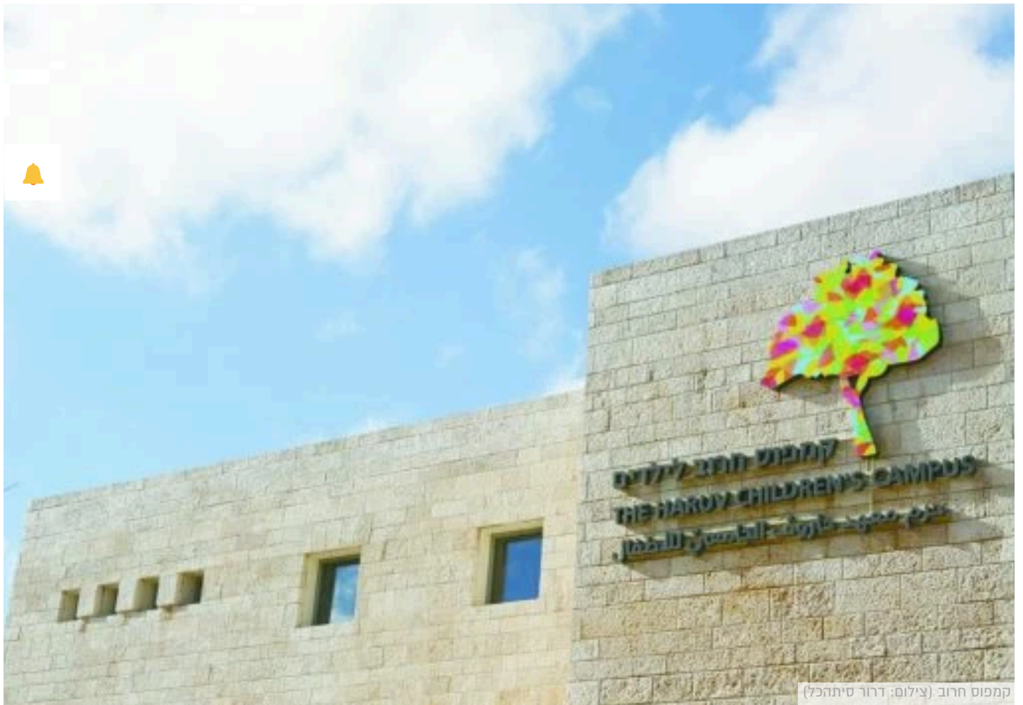
קמפוס חרוב