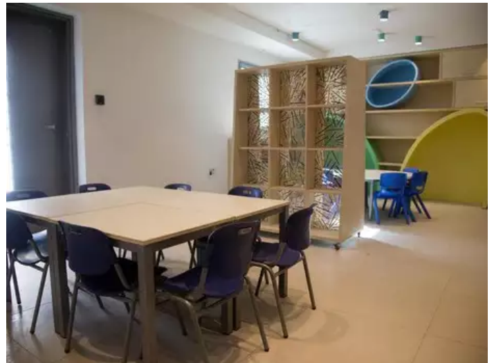
בנה בצורה ידידותית לילדים, עם כיתות צבעוניות וחדר אוכל נעים. המרכז החדש

אחוז גבוה מהילדים המגיעים למרכז הוא בשל פגיעות מיניות. בשנה החולפת 2016, 94% מהילדים שהגיעו חוו פגיעה מינית, ו-6% הנוותרים בשל פגיעה אחרת. מבחינת מגדר, יחס הבנות והבנים שנפגעו מינית כמעט זהה: 272 (52%) הן בנות, ו-249 (48%) הם בנים. עוד עולה מהנתונים כי מרבית הילדים שנפגעו מינית, הן בתוך המשפחה או מחוצה לה, נפגעו בידי אדם המוכר להם.